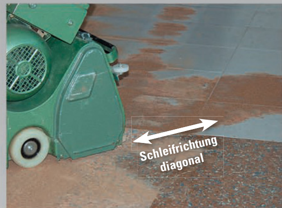
Bei der HUMMEL® muss die Schleifrichtung beachtet werden.

Wichtig: Die HUMMEL® kann nicht zum Schleifen von furnierten Korkfußböden eingesetzt werden, weil Gefahr besteht, die dünne Korkschicht durchzuschleifen.