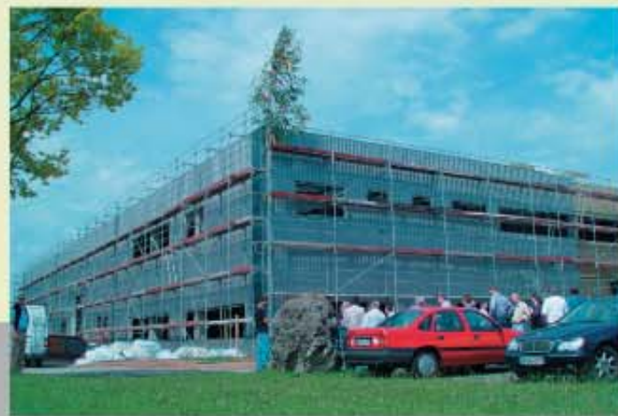
Obwohl dieser Festakt bei einem Industriebau nicht mehr üblich ist, fühlen sich LÄGLER dem Bauhandwerk und seinen Traditionen verbunden.

Besonders diskutiert haben wir auch die Frage des Standorts. Attraktive Angebote aus dem osteuropäischen Ausland und den USA lagen vor und erleichterten die Ent-