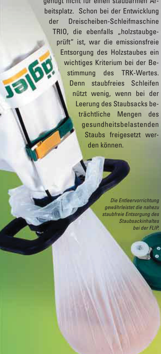
Die Entleervorrichtung gewährleistet die nahezu staubfreie Entsorgung des Staubsackinhaltes bei der FLIP.

LÄGLER präsentiert die innovative Entleervorrichtung erstmals auf der Domotex 2005 in Hannover, Halle 8 Stand A37, aber auch auf der CASA in Salzburg und der IHM in München, wo die Innovation im Mittelpunkt stehen.