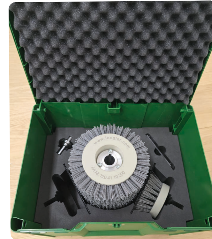
100.99.02.100 Set Spazzola a rullo con spazzola a disco in nylon in systainer ® Il set comprende rullo a spazzola, systainer ® , imbottitura di fondo, spazzola a disco in nylon, adattatore e copertura per i fori dell'aggregato nel corpo HUMMEL ® .