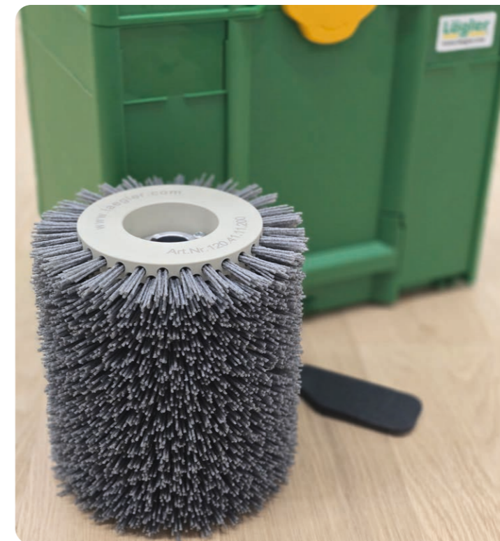
100.99.01.100 Set Spazzola a rullo con systainer ® Il set comprende rullo a spazzola, systainer ® , imbottitura di fondo e copertura per i fori dell'aggregato nel corpo HUMMEL ® .